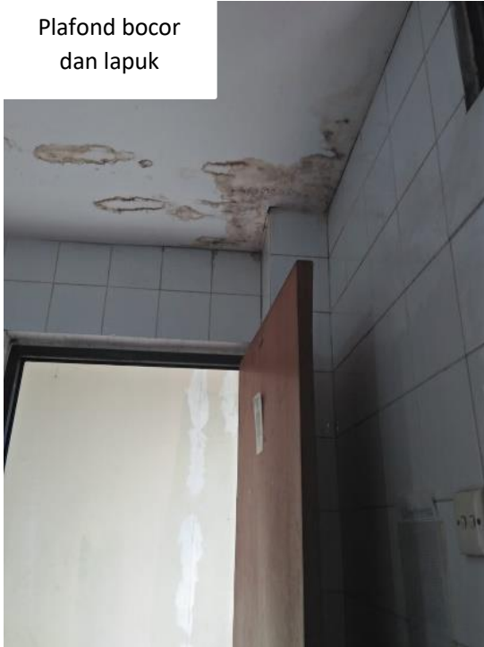
Plafond bocor dan lapuk