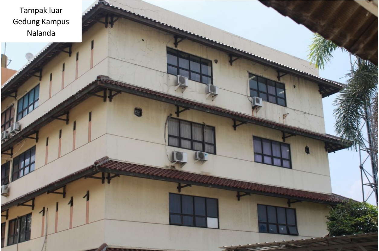
Tampak luar Gedung Kampus Nalanda